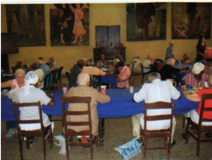
Comedor en una de las parroquias de La Habana