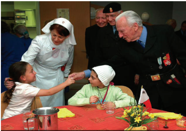
El Gran Maestro visitando a los enfermos en Lourdes, 2006

Los católicos creemos que nuestra madre bendita, la Virgen María, se le apareció a una muchacha campesina francesa - Bernadette Soubirous - en 18 ocasiones durante varios meses en 1858. La Virgen María pidió que la gente viniera a Lourdes en un peregrinaje - que se ha estado haciendo por casi 150 años. Lourdes atrae a seis millones de personas cada año.